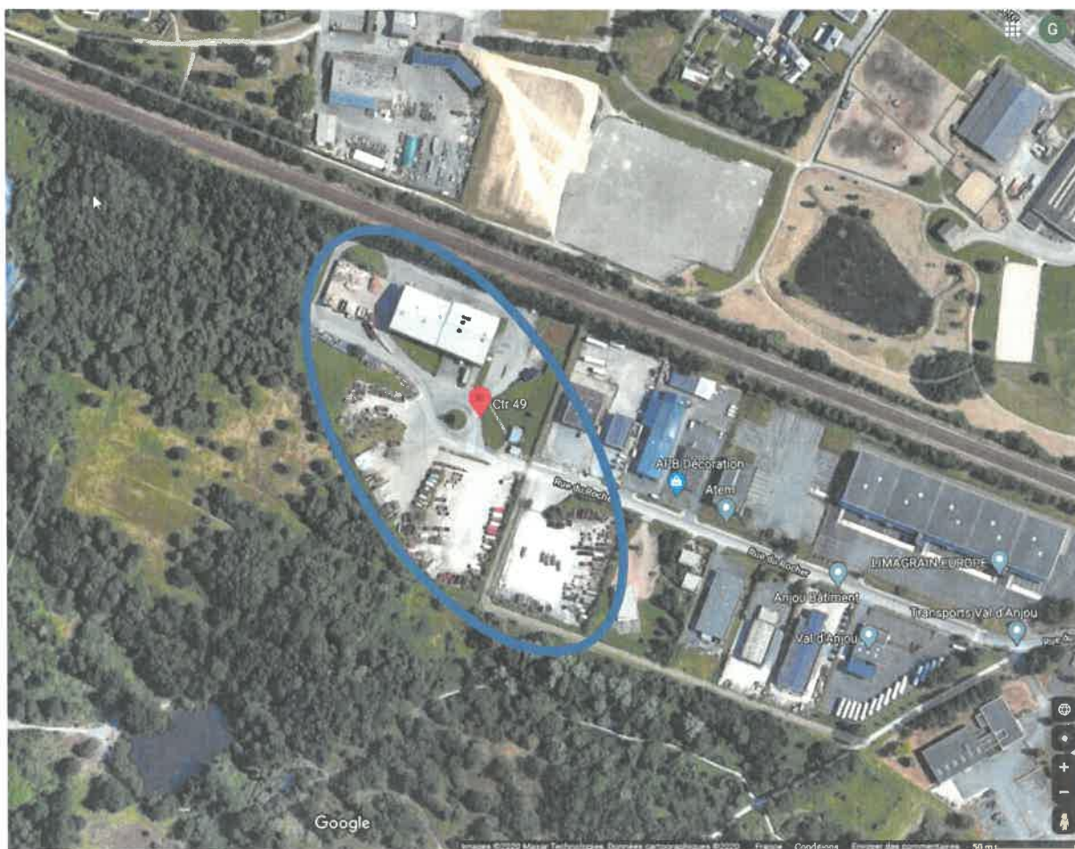
Centre de tri et valorisation 49 – 28 rue du Rocher 49800 Trélazé