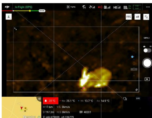
Figure 2. La définition de la caméra thermique permet l'identification nocturne de la plupart des points chauds détectés. Ici, un lièvre dans une luzerne

Lorsqu'un nid est repéré, les données GPS associées sont directement enregistrées par le drone. Ainsi acquises sans aucun accès au nid, les localisations seront transmises aux salariés de la LPO et reportées dans un logiciel d'analyse cartographique.