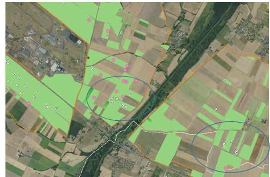
Cartographie des parcelles à étudier sur la ZPS (Test 2021) © LPO Anjou

Le drone permet de prospecter environ 100ha en 4h. Les parcelles sont sélectionnées en amont en se basant sur les connaissances acquises lors des suivis réalisés par la LPO et en tenant compte de la nécessité de réduire les déplacements pour couvrir un maximum de surface. Les agriculteurs concernés sont informés de l'intervention.