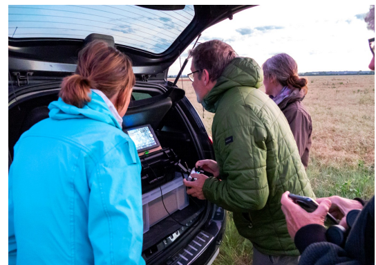
Pilotage du drone sur la ZPS (Test 2021)

Les prospections sont réalisées sous forme d'allers retours successifs de manière à couvrir l'ensemble de la parcelle. La vitesse de vol est comprise entre 15 et 20 km/h. La hauteur de vol, environ 30m, permet de couvrir une largeur au sol d'environ 20m lors de chaque longueur. Lorsqu'un point chaud est détecté, l'identification est réalisée à l'aide de la caméra non thermique équipée d'un zoom X30 si les conditions de luminosité le permettent ou en descendant un peu plus bas pour avoir une image thermique plus précise. Dans les rares cas où le doute persiste sur la nature du point chaud, le point est revisité une fois le jour levé.