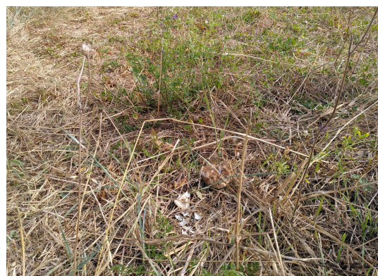
Nid écrasé dans une jachère de la ZPS de Méron

Malgré tout, plusieurs sources de dérangement et destruction persistent (passages d'engins dans les parcelles, tourisme, négligence, malveillance, etc). S'il n'apparaît pas nécessaire de réaliser des captures et prélèvements comme dans le département voisin, la localisation précise des nids s'avère, en plus des connaissances apportées, indispensable à la protection des nichées. Testée sur le site en 2021, la méthode de recherche des nids par drone a fait ces preuves en permettant de trouver deux nids sur trois. Il apparaît donc plus que pertinent d'intégrer le drone à la méthodologie de suivi afin de protéger au mieux cette population saumuroise.