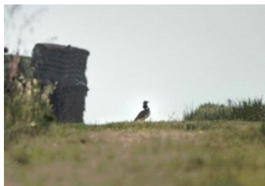
Mâle d'outarde sur la ZPS de Méron

Avec 13 à 24 mâles chanteurs présents chaque année (Suivis LPO Anjou 2015-2021), le site Natura 2000 Champagne de Méron, Plaine de Douvy et la Butte d'Antoigné hébergent les derniers individus de la population angevine d'outardes canepetières et représentent donc un enjeu majeur à l'échelle nationale. A ce titre, des Mesures Agro-Environnementales et Climatiques sont mises en œuvre dans le cadre d'un partenariat PNR-LPO. Au sein de la ZPS, l'espèce occupe principalement les parcelles concernées par ces mesures.