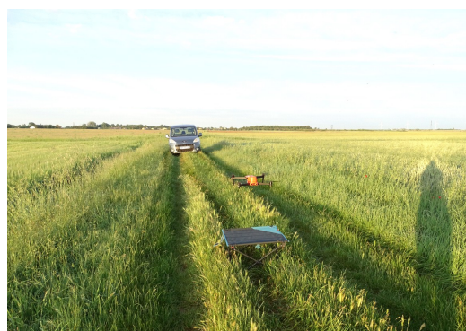
Le drone DJI Matrice 210 sur la ZPS (Test 2021)

Le drone utilisé un DJI Matrice 210 (homologué S1, S2, S3) équipé d'une caméra thermique Zenmuse XT1 V2 640*512 30Hz 19mm et d'une caméra classique avec zoom x30 : la Zenmuse Z30. Cette dernière est retirée lors des prospections nocturnes. 18 batteries TB50 permettant une durée de vol d'environ 2h (environ 15 min par jeu de 2 batteries). Deux stations de charge pour batterie TB50 permettent de recharger les batteries au fur et à mesure de leur utilisation via un groupe électrogène et ainsi de ne pas être limité par la durée de vol du drone lors des prospections.