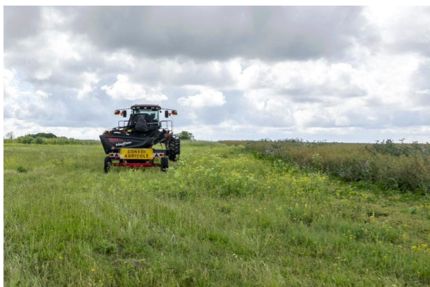
Fauche des bordures avant récolte, à quelques cm du nid

L'Outarde canepetière est confrontée à un risque élevé d'extinction sur le territoire national. Nichant au sol dans les plaines cultivées, l'intensification agricole représente le risque le plus important pour cette espèce, notamment par le dérangement et la destruction directe des nichées lors des travaux agricoles.