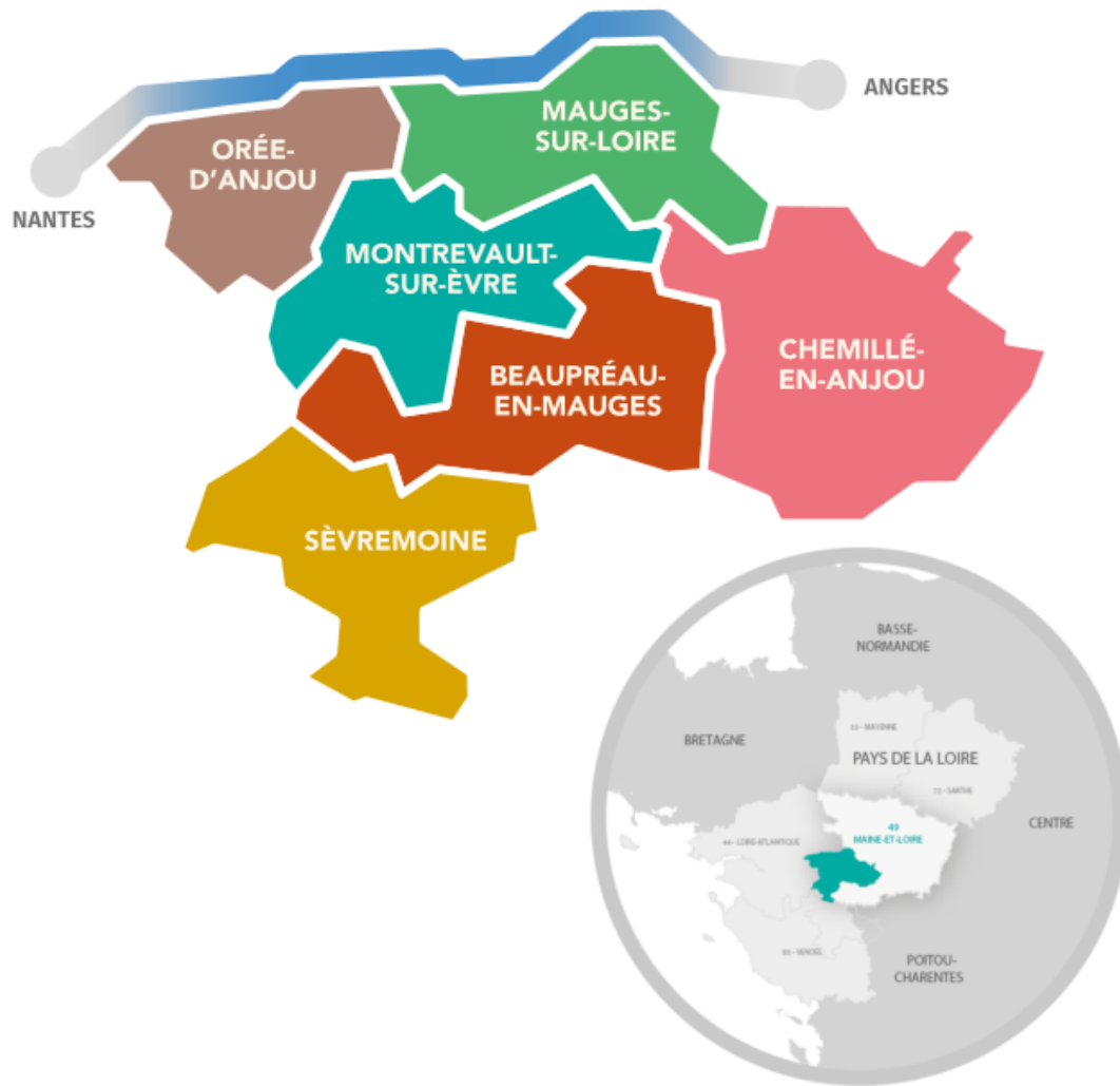
Carte des six communes nouvelles du Pays des Mauges

Le territoire de la commune nouvelle de Mauges-sur-Loire est concernée par deux « pôles principaux associés » identifiés par le SCoT à savoir Montjean/ La Pommeraye / Chalonnes 3 et Saint-Florent-le-Vieil / Varades 4 .